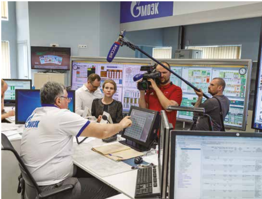
Отправная точка пресс-тура — Центральное диспетчерское управление ПАО «МОЭК». Для сотрудников ЦДУ уже стали привычными регулярные визиты людей с микрофонами и камерами

15 мая Управление по связям с общественностью и СМИ провело пресс-тур для журналистов ведущих российских и московских средств массовой информации. Темой стала подготовка системы теплоснабжения Москвы к отопительному сезону — 2019/2020. Корреспонденты увидели, как «МОЭК» готовит системы теплоснабжения к зиме. Лейтмотив мероприятия — почему каждый год горожане вынуждены несколько дней проводить без горячей воды. Предлагаем вашему вниманию фоторепортаж о наиболее ярких моментах пресс-тура