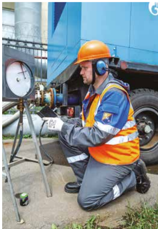
Следующий пункт пресс-тура — ТЭЦ-12 ПАО «Мосэнерго», где работает мобильная опресновочная станция «МОЭК» и проходят испытания теплотрассы: воду запускают в трубы под большим напором, и далее специалисты наблюдают за появлением протечек на трубопроводе. По мере выявления дефекты оперативно устраняются