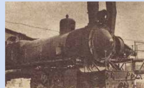
Статьи об интересной находке появились тогда в нескольких советских периодических изданиях

Паровоз С68 — единственный уцелевший представитель серии С, построенный в 1913 году, был обнаружен в 70-е годы на территории завода железобетонных изделий на Хорошевском шоссе, где он использовался в качестве временной котельной. Энтузиасты из клуба любителей железных дорог сумели заинтересовать судьбой машины Всероссийское общество охраны памятников истории и культуры (ведь именно такие паровозы перевозили в 1918 году российское правительство при переносе столицы из Петербурга в Москву) и Министерство путей сообщения. Локомотив было решено восстановить. Так началась новая история «хорошевского» паровоза. С 2017 года, после многочисленных переездов, он занял место в Музее железных дорог России на Балтийском вокзале в Санкт-Петербурге.