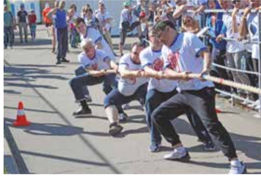
Больельщики Филиала № 9: вместе, дружно – к победе!

Настоящий командный дух пловцы проявили в смешанной эстафете и сумели опередить всех соперников. Итог – первое место в общекомандном зачете.