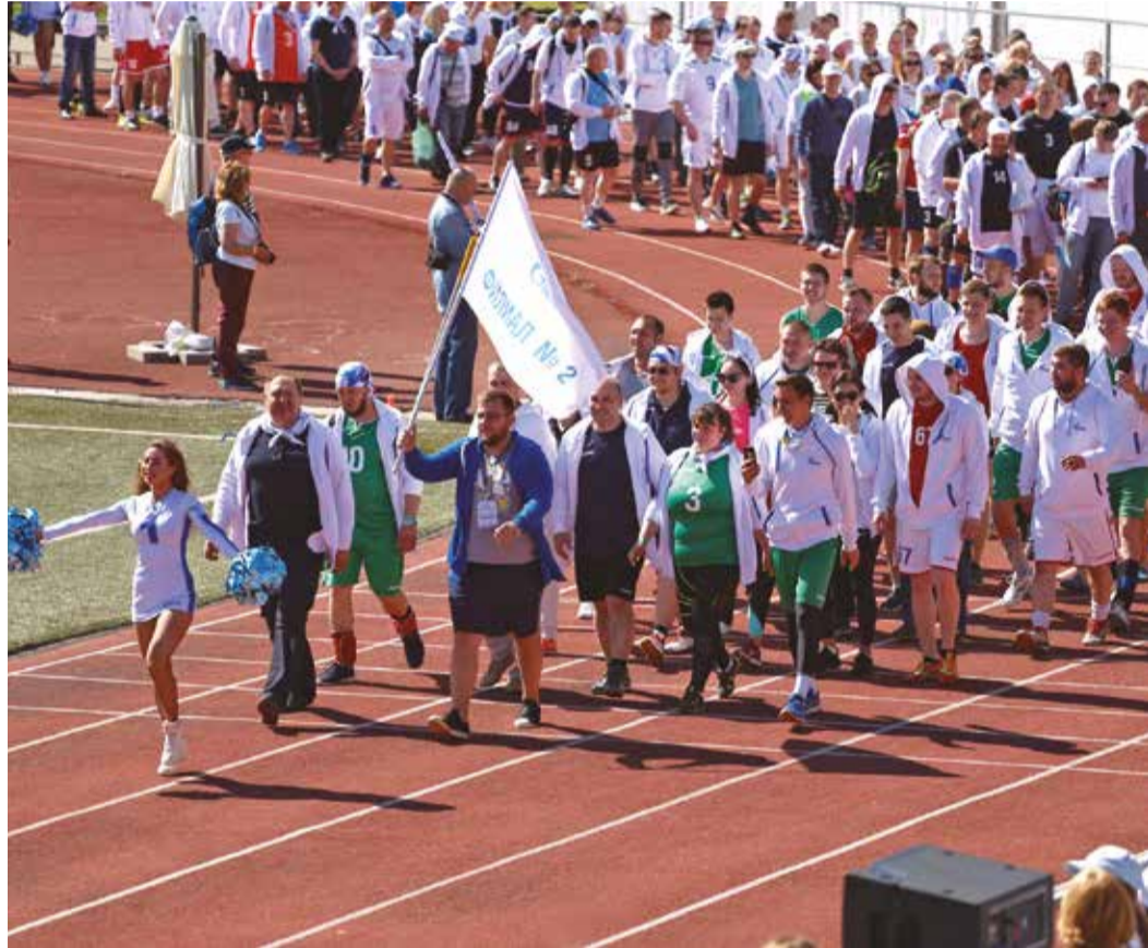
Растет и квалификация спортсменов, и интерес болельщиков!

Самое главное, что хотелось бы отметить по итогам прошедшей спартакиады, что от года к году все идет и развивается очень динамично. Учитывается опыт прошлых лет, вносятся коррективы, дополнения, проходят обкатку новые идеи, что-то принимается, что-то, наоборот, отсеивается. Таким образом, качество и уровень мероприятия растут, как растет и квалификация наших спортсменов, и интерес болельщиков. ■