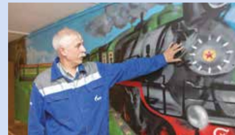
Паровоз серии СВ, «Сормовский усиленный», — самый массовый советский пассажирский паровоз

Во всю стену комнаты приема пищи предприятия № 1 вытянулось изображение поезда. Такой необычной «открыткой» коллектив предприятия «Хорошево-Мневники» поздравил своего директора с днем рождения в 2010 году.