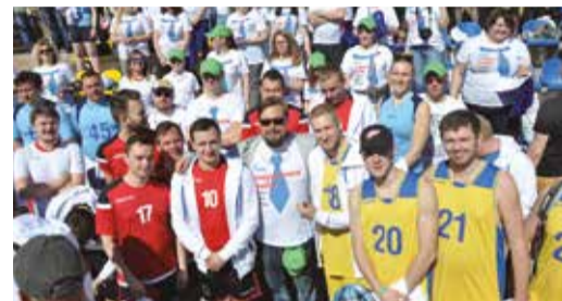
Занятия спортом – отличная возможность проявить свои лучшие качества и навыки, необходимые и на спортплощадке, и в повседневной работе

Руководство филиала выражает слова благодарности всем, кто принял участие в спартакиаде в качестве спортсменов, спортсменов-болельщиков, активно борющихся в отдельной соревновательной программе, и просто болельщикам, подарившим коллегам позитив и бодрость духа, желает новых побед и достижений и в спорте, и производстве!