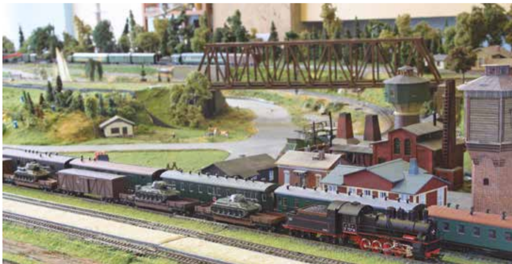
Все для фронта, все для Победы. Паровоз Эм 737-51, как и его прототип, в годы войны работавший в прифронтовой полосе Северо-Западного фронта, ведет эшелон с уральскими танками на запад. На параллельном пути — санитарный эшелон эвакуирует раненых в тыл. Паровоз и вагоны произведены петербургской фирмой «Пересвет» с небольшими доработками силами членов МТТК (у платформ опущены борта для погрузки танков), танки производства «Студия Али»

Основное направление деятельности клуба — не коллекционирование, а именно моделизм, создание макетов железных дорог, станций, вагонов, паровозов и тепловозов. «Наш последний клубный проект — вагоны совре-