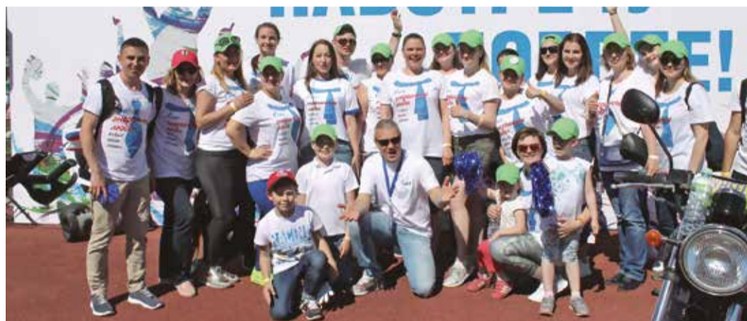
Спартакиада – не только азарт борьбы и радость побед. Это еще и праздник хорошего настроения!