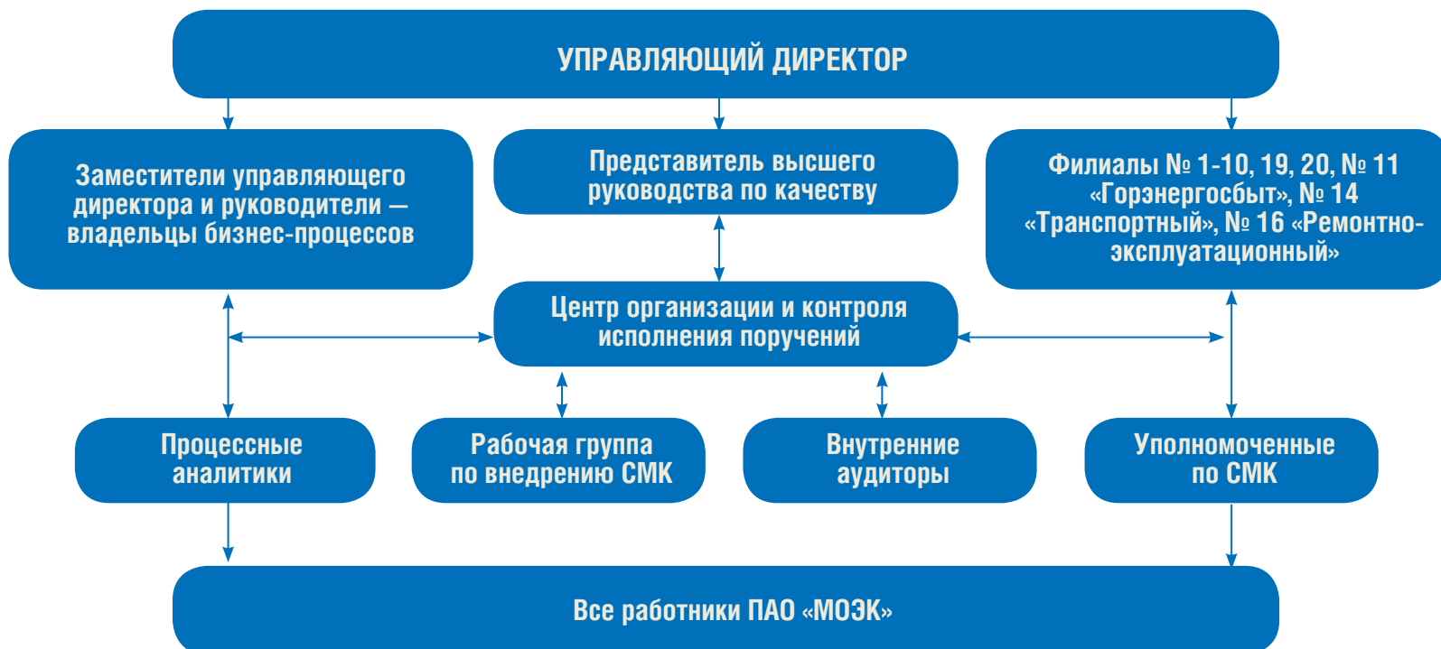
СХЕМА ВЗАИМОДЕЙСТВИЯ УЧАСТНИКОВ СМК В ПАО «МОЭК»

В 2020 году в ПАО «МОЭК» внедрена система менеджмента качества (далее – СМК). Область применения СМК распространяется на все подразделения АУ и филиалы ПАО «МОЭК», что подразумевает вовлечение в систему абсолютно всех сотрудников