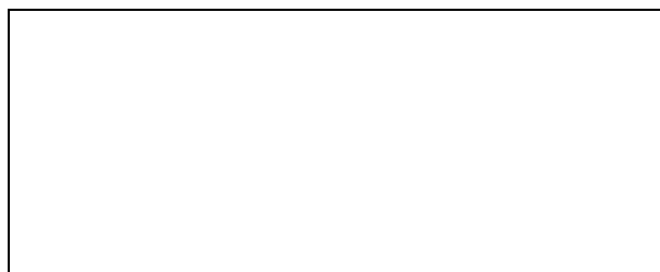
Схема границы балансовой принадлежности тепловых сетей

Прочие сведения по установлению границ раздела балансовой принадлежности тепловых сетей _____